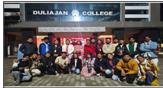
২০২৫-২৬ বৰ্ষৰ ডিব্ৰুগড় বিশ্ববিদ্যালয়ৰ আন্তঃমহাবিদ্যালয় যুৱ মহোৎসৱত সৰুপথাৰ মহাবিদ্যালয়ৰ দল