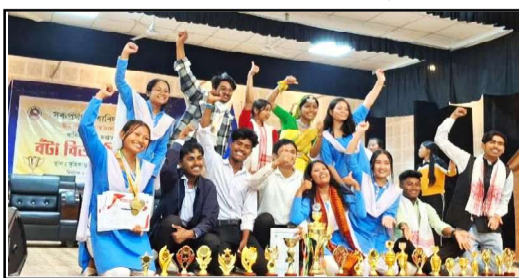
মহাবিদ্যালয় সপ্তাহ ২০২৬ বৰ্ষৰ শ্ৰেষ্ঠ বিভাগ ইতিহাস বিভাগ