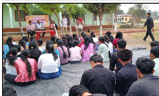
ৰাজনীতি বিজ্ঞান বিভাগৰ সতীৰ্থ সন্মিলন