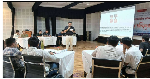
সৰুপথাৰ মহাবিদ্যালয়ত অসম ভিত্তিত কুইজ প্ৰতিযোগিতা