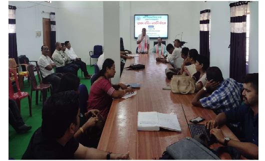
অসম কলেজ শিক্ষক সংস্থা গোলাঘাট মাণ্ডলিক সমিতিৰ প্ৰথম বৰ্ষিত কাৰ্যনিৰ্বাহক