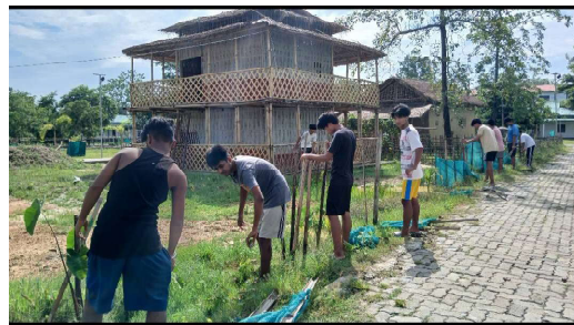
সৰুপথাৰ মহাবিদ্যালয়ৰ বীৰ চিলাৰায় ছাত্ৰবাসৰ ছাত্ৰসকলে স্বেচ্ছামূলক সেৱা আগবঢ়ায়।