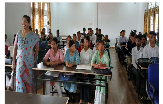
সৰুপথাৰ মহাবিদ্যালয়ত অনুষ্ঠিত হোৱা নিয়োগ মেলাৰ আলোকচিত্ৰ